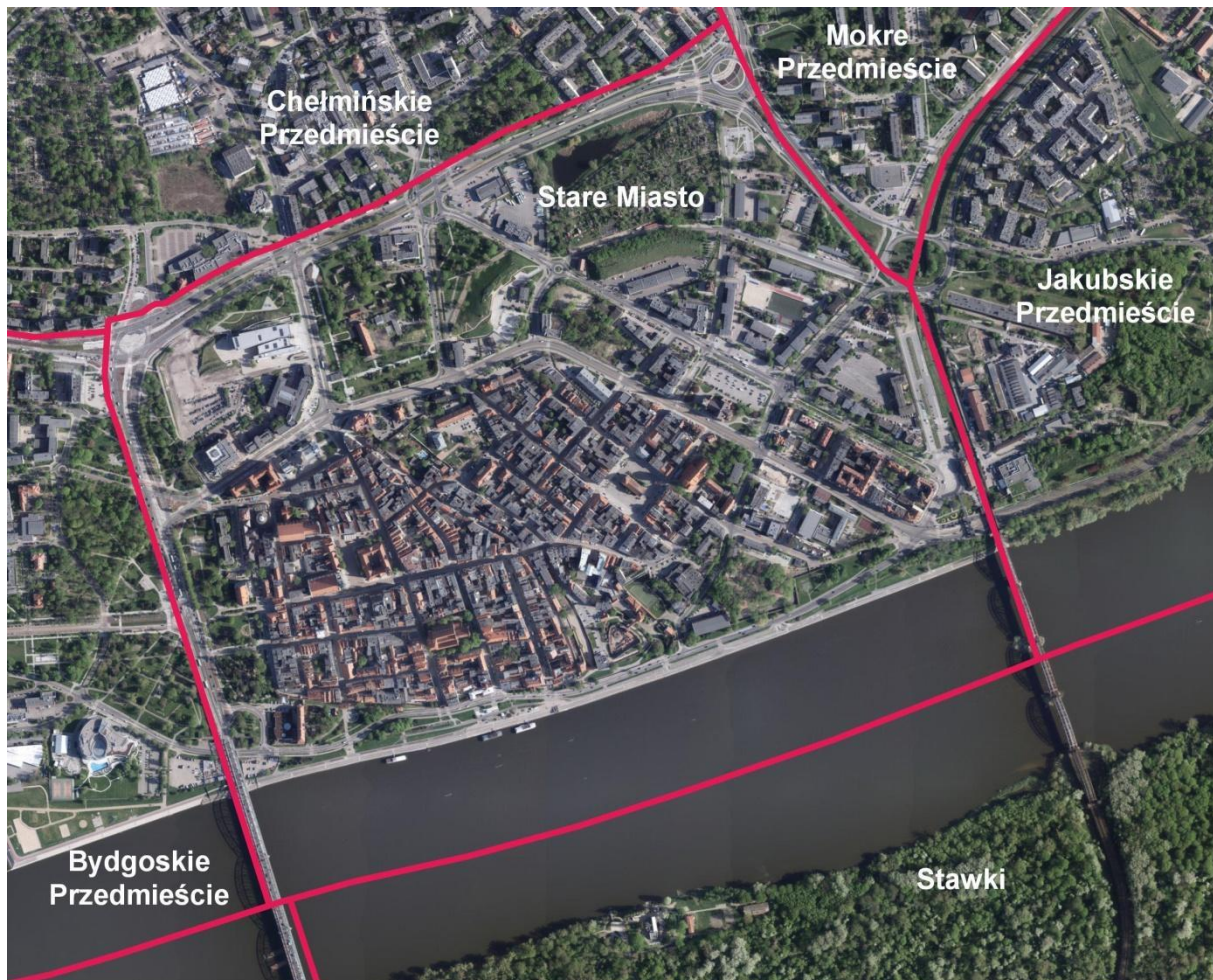
Rysunek 1 Granice obszaru rewitalizacji miasta Torunia – Stare Miasto

Granice poszczególnych podobszarów zaprezentowano na mapach poniżej: